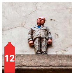
Galerie des Princes Prinsengalerij