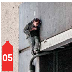
Rue des Pierres 23 Steenstraat 23 (AB Café)