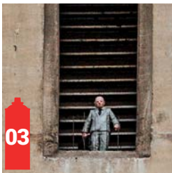
Rue du Midi X Rue Henri Maus (Bourse) Zuidstraat X Henri Mausstraat (Beurs)