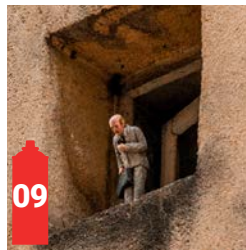
Rue des Bouchers 8-10 Beenhouwersstraat 8-10