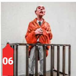
Rue du Midi 57 Zuidstraat 57 (Fresh)