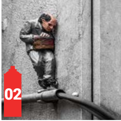
Boulevard Anspach 69a Anspachlaan 69a (Pizza Hut)