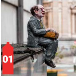
Rue Paul Devaux Paul Devauxstraat