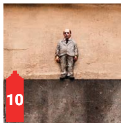
Impasse de la Fidélité Getrouwheidsgang