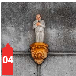
Rue des Pierres 23 Steenstraat 23 (AB Café)