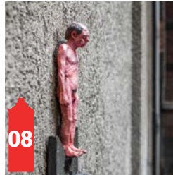
Impasse de la Tête de Boeuf Ossekopgang