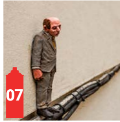
Petite Rue Des Bouchers 2 Korte Beenhouwersstraat 2