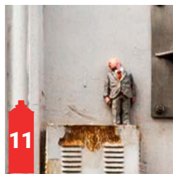
Rue des Dominicains Predikherenstraat (Brussels Burgers)